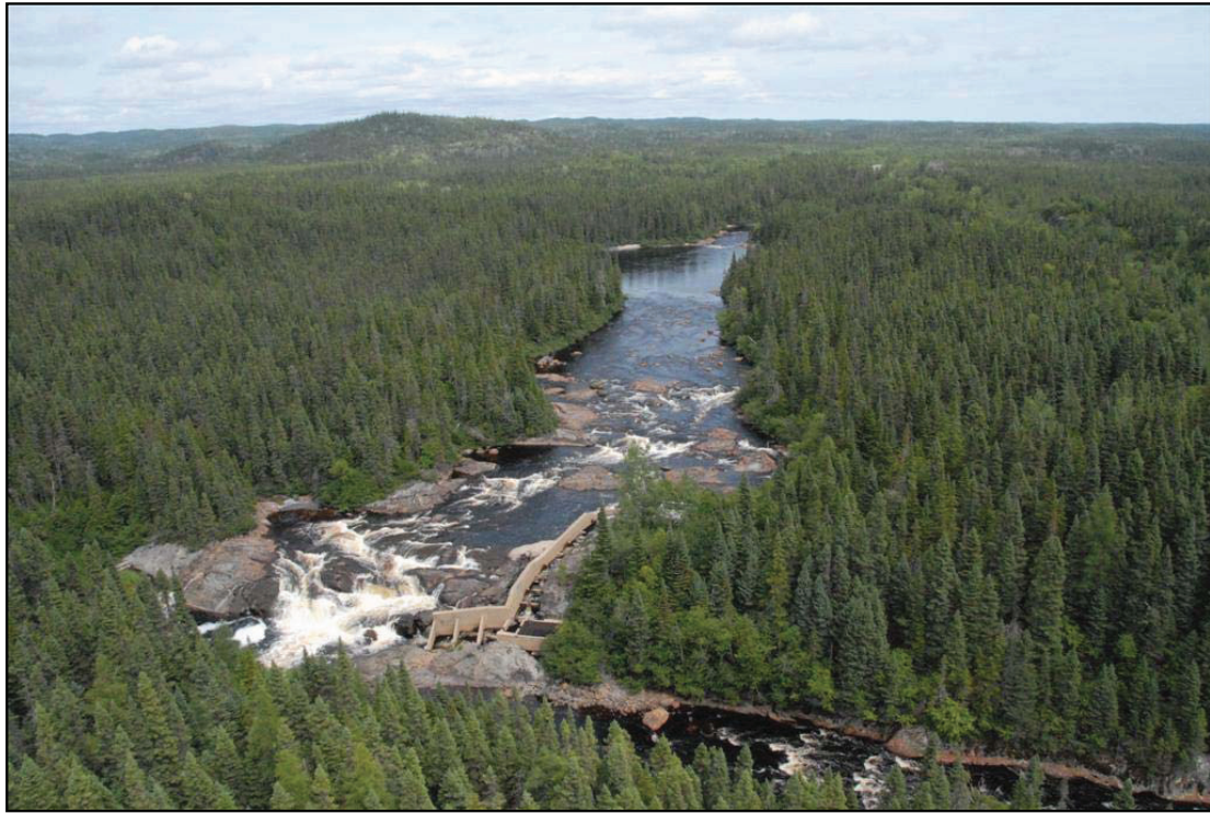
Passe migratoire du saumon sur la rivière Matamec

En 1984, l'institut de recherche doit fermer ses portes, faute de fonds. Certains travaux ont tout de même été poursuivis, dont un programme de monitoring mis sur pied en 1981 pour suivre la qualité de l'eau des rivières de la Côte-Nord et un programme de biomonitoring datant de 1987 sur la réponse des communautés biologiques face aux précipitations acides. Ces deux programmes de suivi, gérés par le ministère canadien des Pêches et des Océans ont pris fin en 1996.