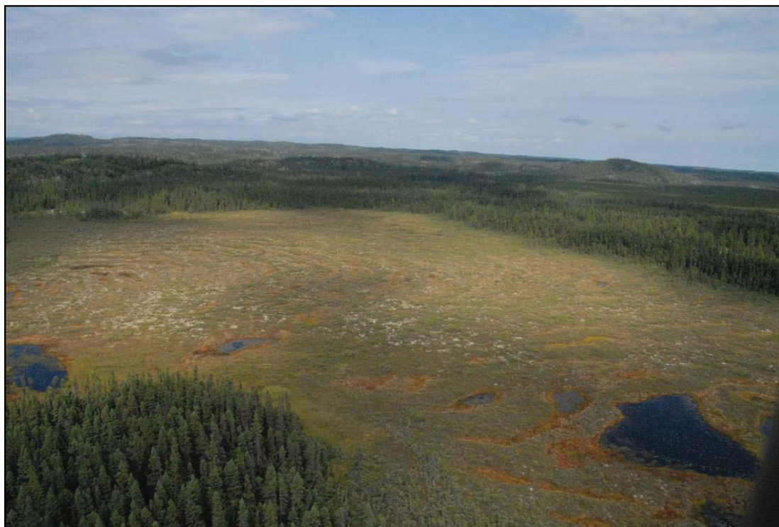
Tourbière ombrotrophe bombée excentrique localisée dans la partie sud du territoire

Faune : Au point de vue faunique, toutes les espèces typiques du milieu boréal sont susceptibles de fréquenter la réserve écologique. Mentionnons, entre autres, la loutre, le renard, le rat musqué, l'ours noir, l'orignal et le castor. Le caribou forestier, un écotype désigné vulnérable au Québec, est aussi présent de façon sporadique dans la réserve écologique. Chez les poissons, le saumon atlantique et l'omble de fontaine sont les deux espèces typiques des rivières de la Côte-Nord qui se rencontrent dans la rivière Matamec. De plus, plusieurs lacs de la réserve écologique sont habités par l'omble de fontaine. Quelques autres espèces moins abondantes, comme l'épinoche à trois et à neuf épines, l'éperlan arc-en-ciel, et l'omble chevalier fréquentent également le lac Matamec ou ses tributaires.