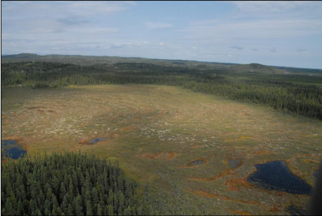
Tourbière ombrotrophe bombée excentrique localisée dans la partie sud du territoire

Faune : Au point de vue faunique, toutes les espèces typiques du milieu boréal sont susceptibles de fréquenter la réserve écologique. Mentionnons, entre autres, la loutre, le renard, le rat musqué, l'ours noir, l'orignal et le castor. Le caribou forestier, un écotype désigné vulnérable au Québec, est aussi présent de façon sporadique dans la réserve écologique. Chez les poissons, le saumon atlantique et l'omble de fontaine sont les deux espèces typiques des rivières de la Côte-Nord qui se rencontrent dans la rivière Matamec. De plus, plusieurs lacs de la réserve écologique sont habités par l'omble de fontaine. Quelques autres espèces moins abondantes, comme l'épinoche à trois et à neuf épines, l'éperlan arc-en-ciel, et l'omble chevalier fréquentent également le lac Matamec ou ses tributaires.