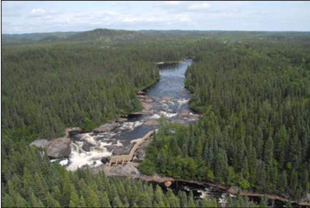
Passe migratoire du saumon sur la rivière Matamec

En 1984, l'institut de recherche doit fermer ses portes, faute de fonds. Certains travaux ont tout de même été poursuivis, dont un programme de monitoring mis sur pied en 1981 pour suivre la qualité de l'eau des rivières de la Côte-Nord et un programme de biomonitoring datant de 1987 sur la réponse des communautés biologiques face aux précipitations acides. Ces deux programmes de suivi, gérés par le ministère canadien des Pêches et des Océans ont pris fin en 1996.