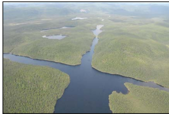
Lac La Croix

La rivière Matamec coule dans sa plus grande partie sur le substratum rocheux. Cinq chutes importantes caractérisent l'aval de la rivière où le dénivelé atteint 120 m à environ 6 km du rivage. La rivière aux Rats Musqués se jette dans la Matamec à environ 2 km de son embouchure. Les eaux de la Matamec se caractérisent par des eaux froides, très douces, bien oxygénées et peu minéralisées typique des milieux oligotrophes. Cette faible minéralisation confère à ces eaux un pouvoir tampon très limité.