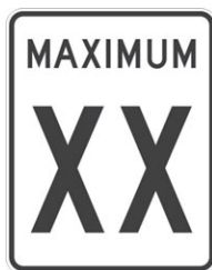
P-70 Limite de vitesse 300 x 375