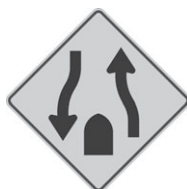
D-90-2 Sentiers séparés 300 x 300