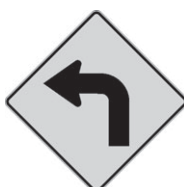
D-110-1-G Virage 300 x 300