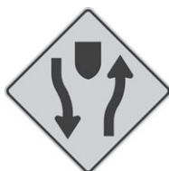
D-90-1 Sentiers séparés 300 x 300