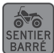
T-80-10 Sentier de véhicules tout terrain barré 300 x 300