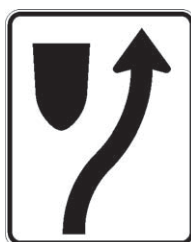
P-90-D Contournement d'obstacles 300 x 375