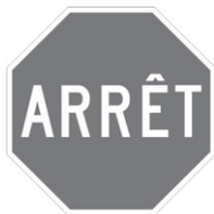
P-10 Arrêt obligatoire 450 x 450