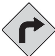
D-110-1-D Virage 300 x 300