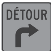
T-90-3-D Détour avancé à droite 300 x 300