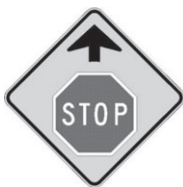
D-10-1 Signal avancé d'arrêt 450 x 450