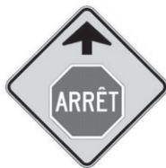
D-10-1 Signal avancé d'arrêt 450 x 450