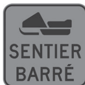
T-80-9 Sentier de motoneiges barré 300 x 300