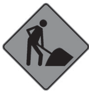
T-50-1 Travaux 300 x 300