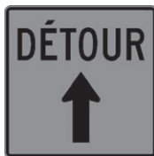
T-90-1 Détour tout droit 300 x 300