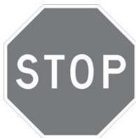
P-10 Arrêt obligatoire 450 x 450