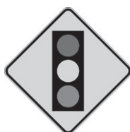
D-50-1 Signal avancé de feux de circulation 450 x 450